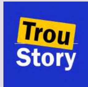
Story de stars